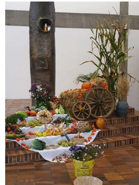
Am 3. Oktober wurden vier Konfirmationen nachgeholt - alle in St. Vinzenz, da die Kirche dort im Moment 80 Sitzplätze hat. Wir danken Pfarrer Dr. Vogler und der Mesnerin von St. Vinzenz ganz herzlich!