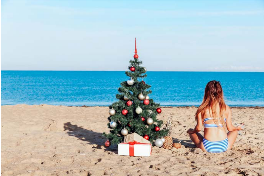
Das Weihnachtsfest wird fast überall auf der Welt gefeiert – unabhängig vom Glauben.

Würde man heute eine Umfrage in irgendeiner Fußgängerzone unserer Republik machen mit der Frage „Was ist Weihnachten für Sie?“, dann wären als Antworten sicher häufig das Fest der Liebe und das Fest des Friedens zu hören. Natürlich käme auch der Geburtstag Jesu mit ins Spiel. Aber, dass das wonnige Christkind nach christlichem Verständnis der Sohn Gottes ist und dass Weihnachten das Fest der Menschwerdung Gottes ist, diese „dogmatische Steilwand“ bleibt