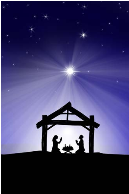
Würstchen mit Sauerkraut, dazu warme Stiefel für den Winter – das war früher ein Fest!