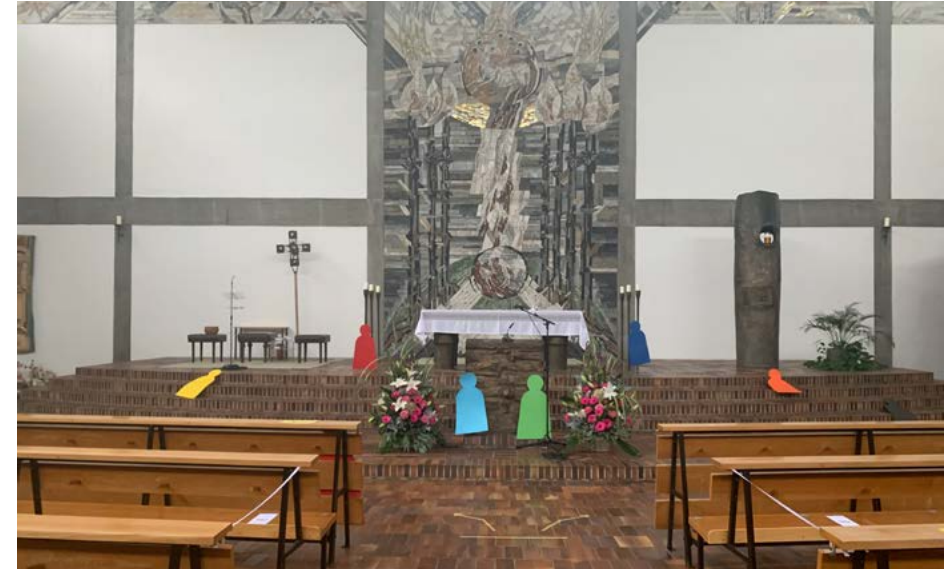
Am 17. Oktober wurden vier weitere Konfirmationen in St. Vinzenz gefeiert. Die Kirchengemeinde ist froh, dass alle Konfirmandinnen und Konfirmanden dieses Jahres vor dem neuerlichen Lockdown konfirmiert werden konnten!